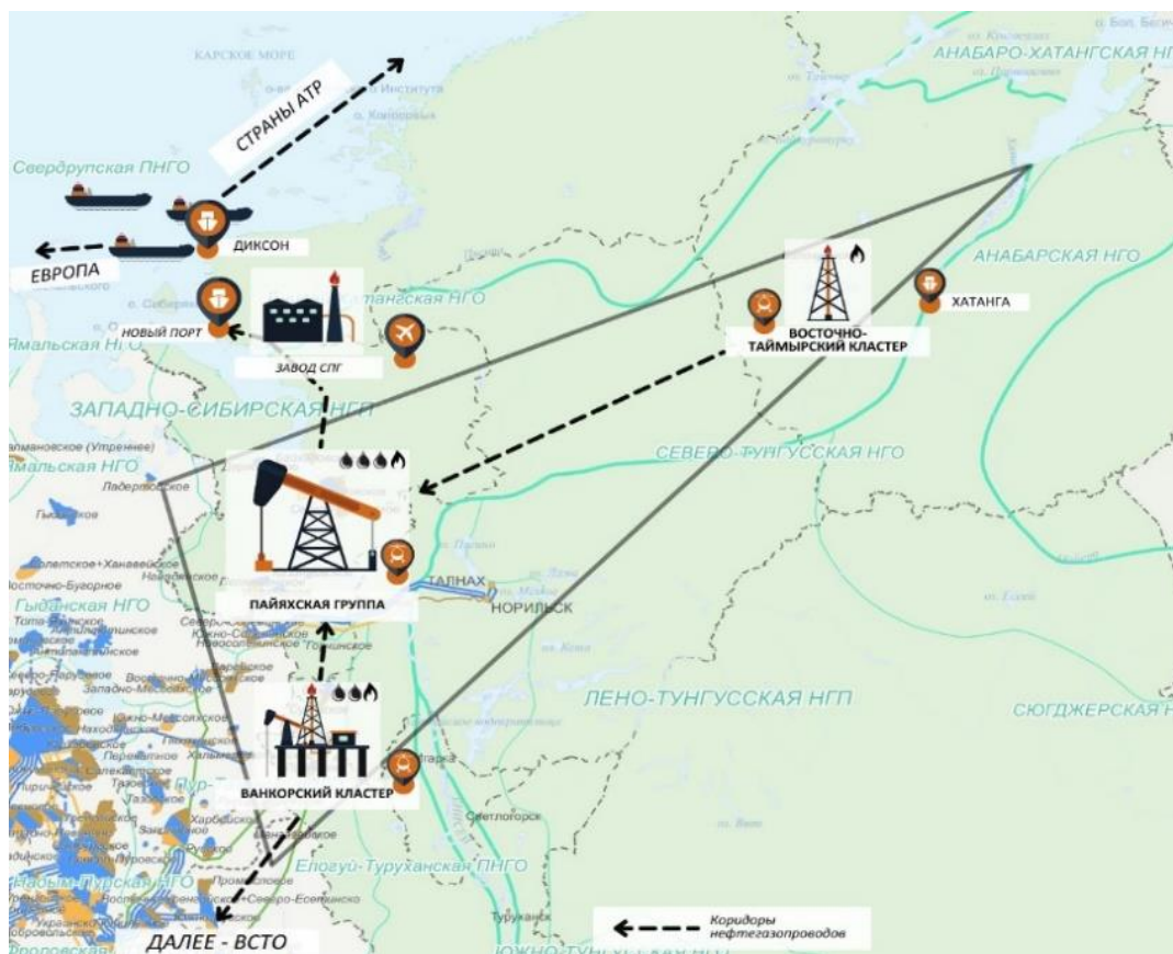
Рис. 3. Схема пространственной организации Енисейского МСЦ

Были получены основные показатели эффективности проекта (организации Енисейского МСЦ) в количественном выражении: NPV составляет -3142 млрд руб., IRR 6,5 %, бюджетная эффективность 50 841 млрд руб.