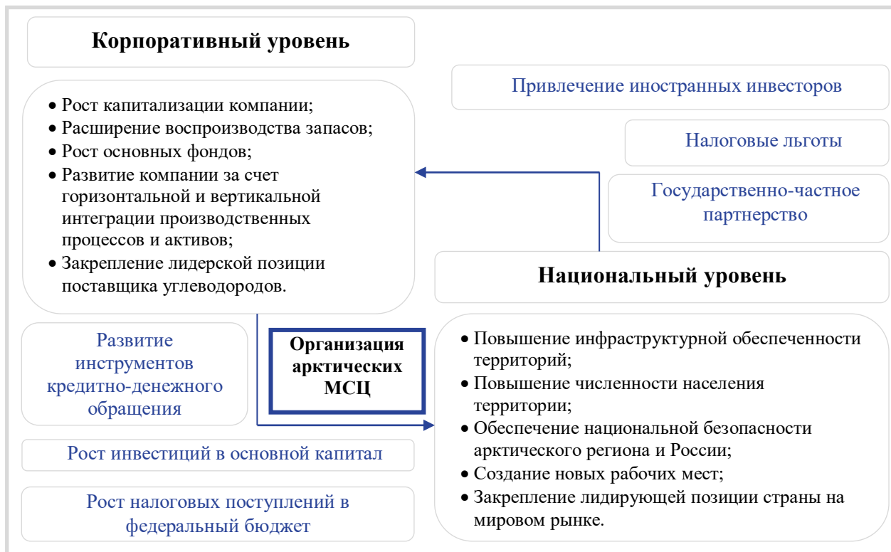
Рис. 1. Взаимодействие национальных и корпоративных приоритетов пространственной организации МСЦ

Сибирской нефтегазоносной провинции (НГП): Енисей-Хатангской НГО и Пур-Тазовской НГО на территории Таймырского Долгано-Ненецкого и Туруханского районов Красноярского края.