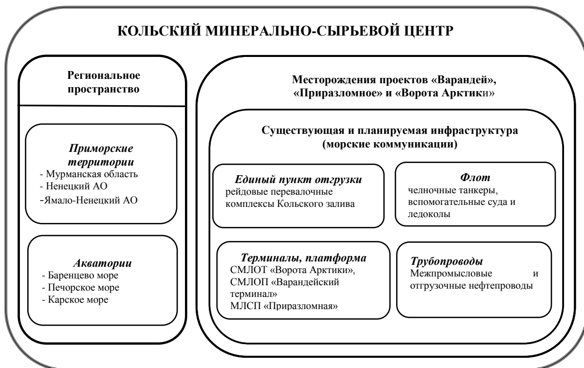
Рис 1. Структура Кольского минерально-сырьевого центра нефти

Структура Кольского МСЦ представлена на рис.1, а эскиз модели перехода к многослойной маркерной пространственной организации – на рис. 3.